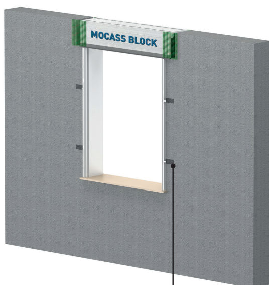
ANCORAGGIO ALLA MURATURA